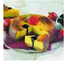
CONSORZIO ACETO BALSAMICO CON IL FESTIVAL DELLA FILOSOFIA ALLA RICERCA DELLA "VERITÀ"