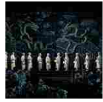
Verona, Turandot di Zeffirelli: allestimento, coro, orchestra e cast di gran livello. La recensione di Fattitaliani