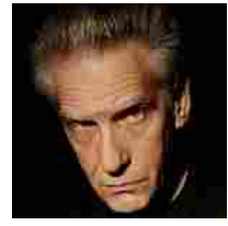
Mostra di Venezia 2018, omaggio a David Cronenberg e Master Class del regista