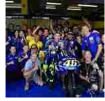
La Top 10 degli sportivi italiani più seguiti sui social